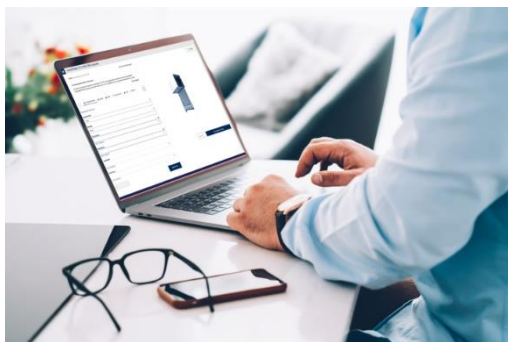
[heroal Business Konfigurator]

I committenti privati possono personalizzare lo schermo solare in base alle loro esigenze nel configuratore di schermi solari heroal.