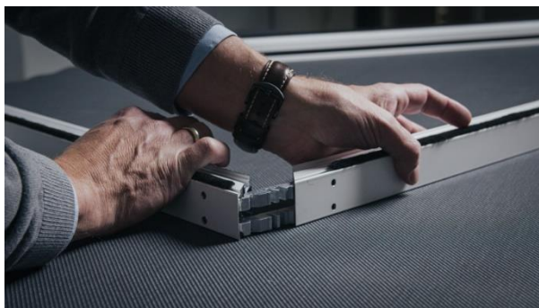
[heroal Ready VS Z EM_Montage_Schritt 2]

Rapidità grazie al formato digitale: nel configuratore Business i partner specializzati heroal possono creare offerte e trasmettere ordini.